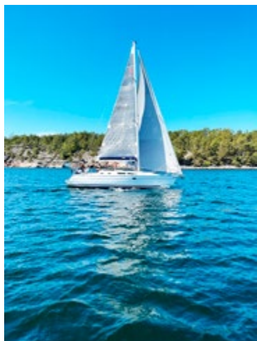
På väg mot riggbyte.