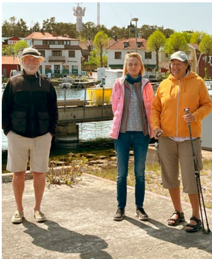
Delar av eskadern på försommarpromenad i Sandhamn.