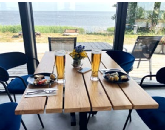
T v: Midsommarbuffé i Köiguste.