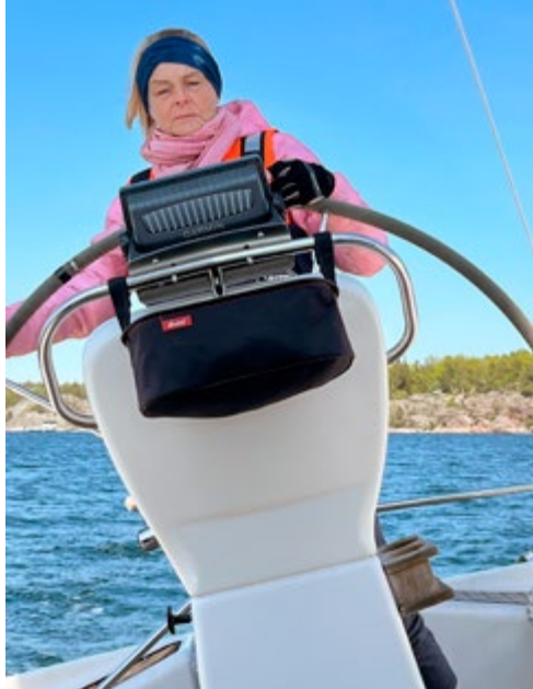
På väg mot sommaren.