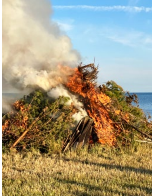
T h: Midsommarbrasa på Ösel.

”Det känns som att segla på en översvämmad åker, alldeles platt och inget som händer”.