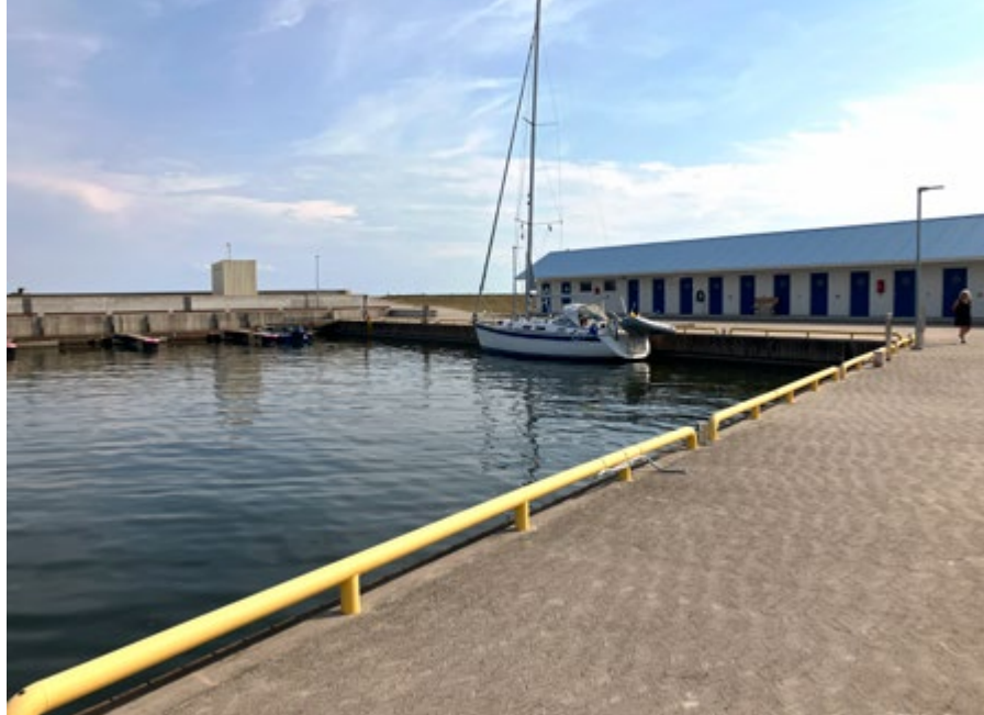
Ensamma i hamnen i Möntu.

att hälsa oss välkomna. Mycket vänlig och hjälpsam, men det kändes som om det var dagens händelse för honom. När vi återgäldade besöket uppe på hamnkontoret satt han och tittade på gamla TV-serier och hade nog rätt långtråkigt. Runt hamnen fanns stora gräsplaner för husbilar. Välklippta men tomma.