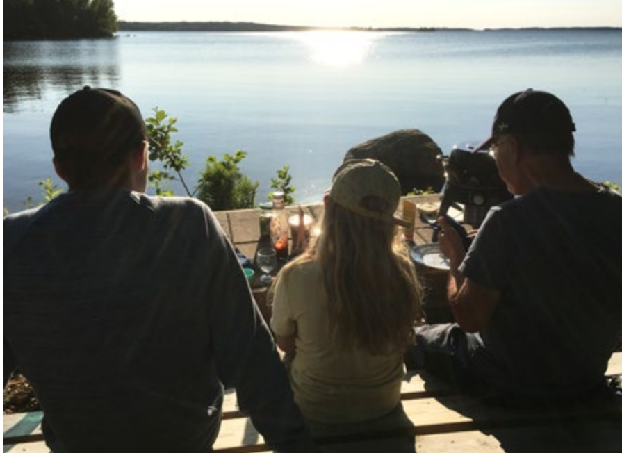
Med barnbarn vid Mälaren.