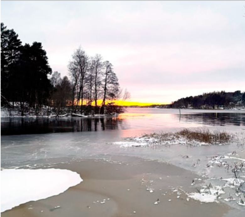
Sen höst.

Avsändare: Svenska Kryssarklubben Uppsala-Roslagskretsen c/o Bo Nordlund Orphei Drängars Plats 5 75311 UPPSALA